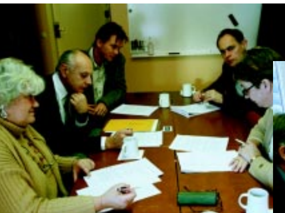
Etiska samtal kräver allvar och engagemang men är också en källa till glädje.

Flera av deltagarna framhåller betydelsen av att tillägna sig metoder för att initiera och utveckla diskussioner och samtal ute på arbetsplatserna: – När arbetet styrdes av